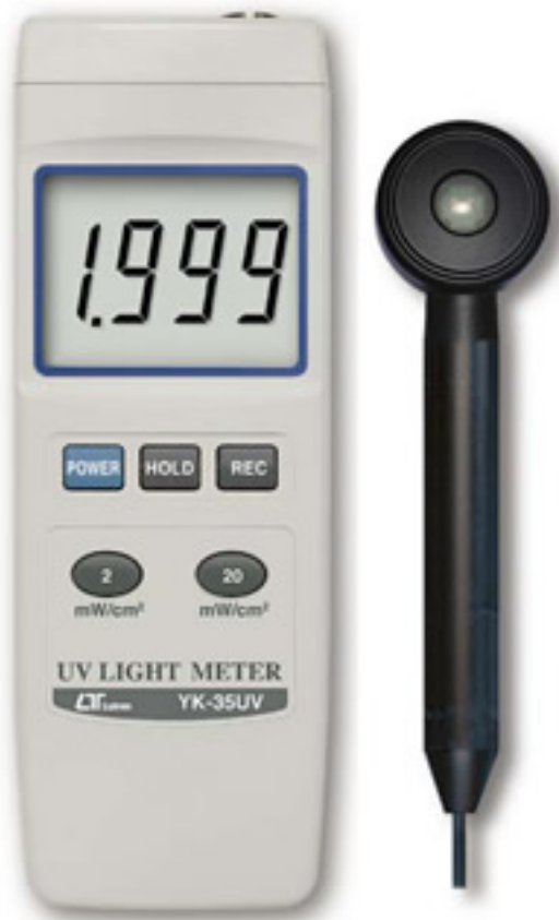
Luxómetro de UV LT-YK35UV